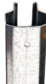
Piquet de tête P200

Design based on hexagonal structure with inward folds that give it a plus of robustness.